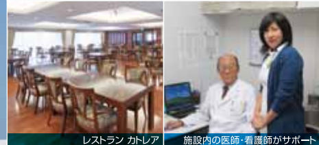
レストラン カフェ