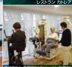
理学療法士・看護師によるトレーニング(無料)