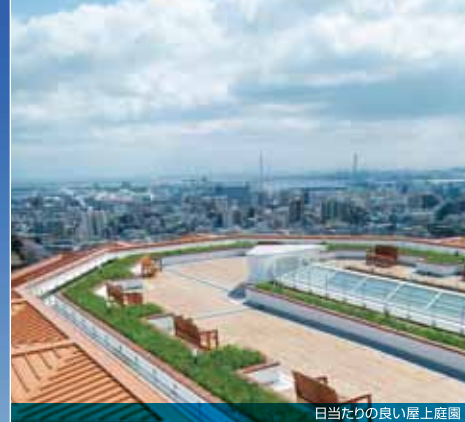
白当たりの良い屋上庭園

六甲山を望む閑静な街並みに加え、都心部への快適なアクセスや豊富な周辺施設が、理想の住環境を実現。 芦屋、岡本の洗練された街でショッピングや習い事など、 従来の生活の延長線上で存分にセカンドライフを楽しめます。