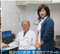
施設内の医師・看護師がサポート