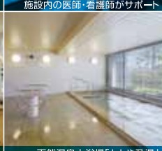
天然温泉大浴場「とや乃湯」