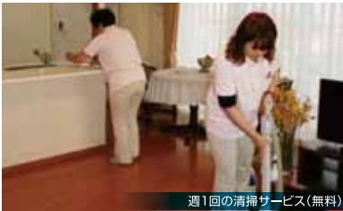
週1回の清掃サービス(無料)

全国第一号の社会福祉法人として、 長年の経験を活かした居室設計と、 ゆったりとした居住スペース(最多居室Aタイプ64.24㎡~) 最適なコミュニケーションがとれる全53室で、 住みやすさを追求しました。