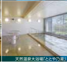
天然温泉大浴場「とや乃湯」