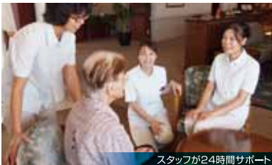
スタッフが24時間サポート

社会福祉法人60年の長い経験を通して 週2回の買い物や週1回の病院送迎など 入居者様の最も必要なサービスを無料にいたしました。 安心して日々の暮らしを満喫いただけます。