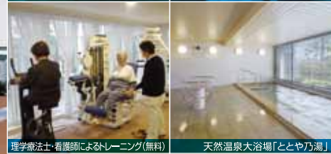
理学療法士・看護師によるトレーニング(無料)