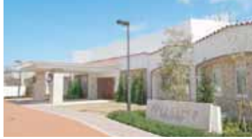
メインエントランス

もちろん生活の拠点である広々とした居室は上質な日常生活を満喫できるように、便利な機能が付いた設備満載の安心設計です。