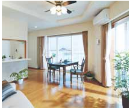
完全個室制・居室