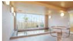
大浴場「ととや乃湯」

送迎バスだけではありません。週2回のお買い物代行（お部屋までお届けします）、週1回の清掃サービス、週1回の病院送迎や理学療法士作成の個別プログラムによる介護予防トレーニングなど、いつも利用者の一番近くにいたるスタッフが親身になつて考えた、無料サービスが充実しています。（ホーム内の天然温泉を毎日利用できるのもウレシイ！）