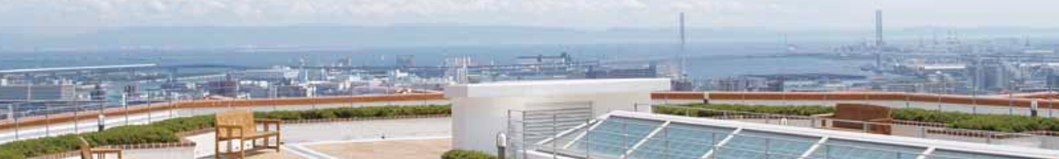
屋外庭園からの景観

※1 24時間個別のケアを受けるには、介護契約を結ばなければなりません。 ※ 社会福祉法人神戸福生会は、昭和26年12月に全国初の認可を受けた社会福祉法人福生会（大阪）の神戸事業法人です。